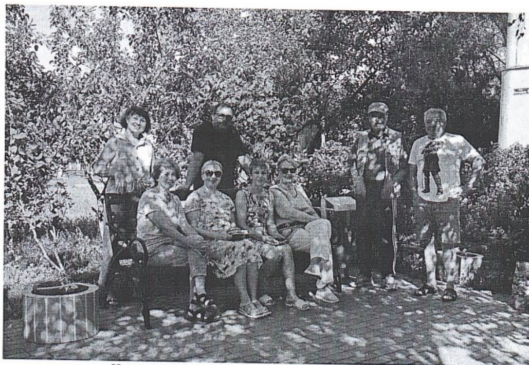
Инициативная группа предварительного обсуждения

6.3. Участие жителей, в определении, обсуждении и утверждении инициативного проекта людей с ограниченными возможностями