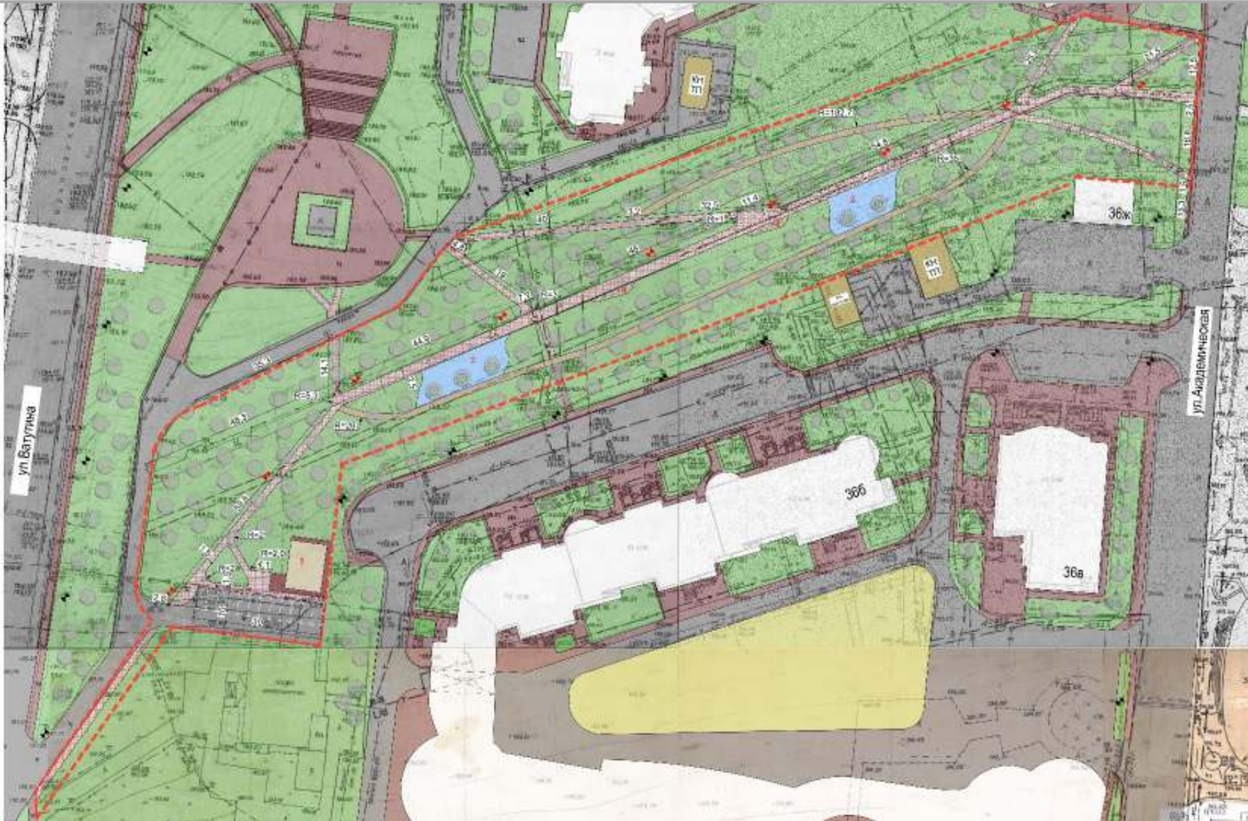
СХЕМА ГЕНЕРАЛЬНОГО ПЛАНА