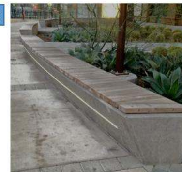
Скамья парковая с подсветкой