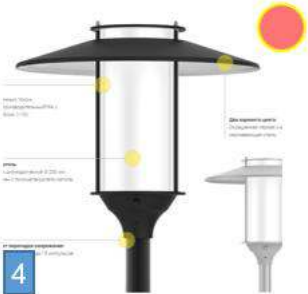
Парковый светильник Rosa ELBA LED черный