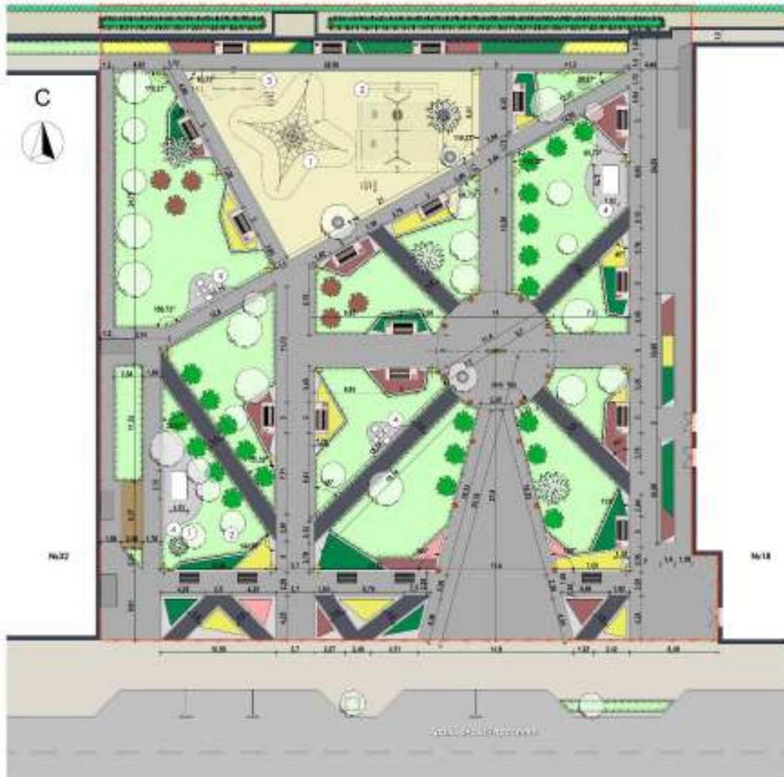
СХЕМА ГЕНЕРАЛЬНОГО ПЛАНА