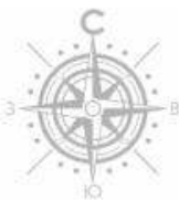
СХЕМА ГЕНЕРАЛЬНОГО ПЛАНА