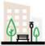
СХЕМА БЛАГОУСТРОЙСТВА ДВОРОВОЙ ТЕРРИТОРИИ ПО УЛ. ПРИВОЛЬНАЯ, 6, 8.