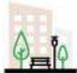
СХЕМА БЛАГОУСТРОЙСТВА ДВОРОВОЙ ТЕРРИТОРИИ ПО УЛ. ВАТУТИНА, 2Б, 2В, 2Г.