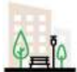
СХЕМА БЛАГОУСТРОЙСТВА ДВОРОВОЙ ТЕРРИТОРИИ ПО УЛ. СТЕПНЯЯ, 1А.