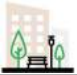
СХЕМА БЛАГОУСТРОЙСТВА ДВОРОВОЙ ТЕРРИТОРИИ ПО УЛ. САДОВАЯ, 41.