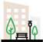
СХЕМА БЛАГОУСТРОЙСТВА ДВОРОВОЙ ТЕРРИТОРИИ ПО УЛ. САДОВАЯ, 41.