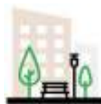
СХЕМА БЛАГОУСТРОЙСТВА ДВОРОВОЙ ТЕРРИТОРИИ ПО УЛ. ГУБКИНА, 18Г.