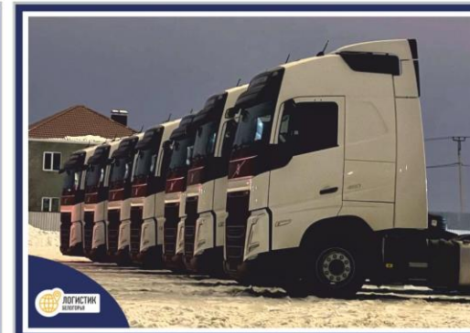
1000x700мм + нельсон серебро 8 шт (разные изображения)