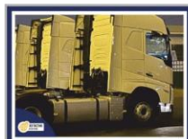
400x300мм + нельсон серебро