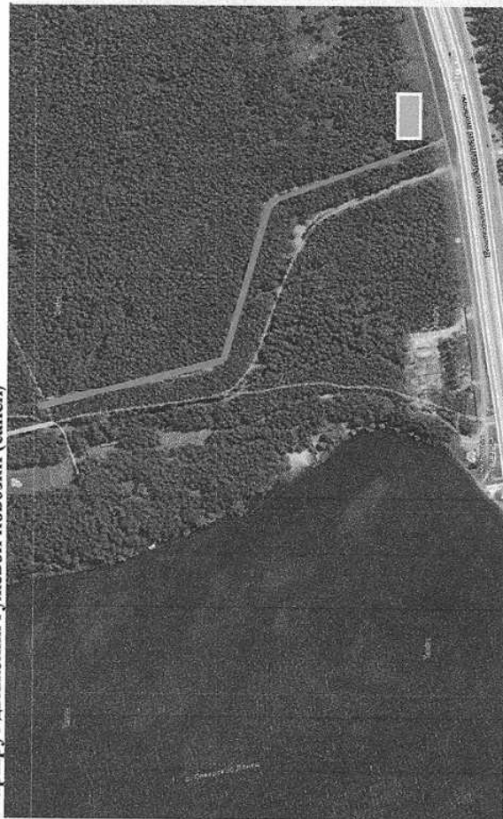
Маршрут движения гужевой повозки (саней)