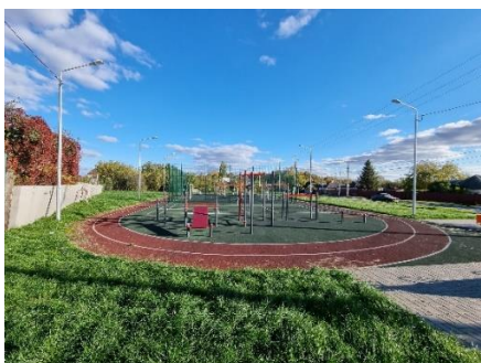
пер. 1 Портовый, 2-4

Совместно с прокуратурой города проведено контрольное мероприятие «Анализ использования бюджетных средств, направленных на устройство детских площадок в рамках муниципального контракта от 21.04.2021 г. № 2021.70».