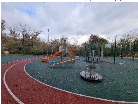
ул. Мелзавод, 2,9-11

спортивных площадок на общую сумму 336 730,99 тыс. рублей. Осмотр планируемых площадок с фиксацией текущего состояния территорий, детского и спортивного оборудования не производился. Также не учитывались особенности каждой отдельно взятой территории, не проводился анализ